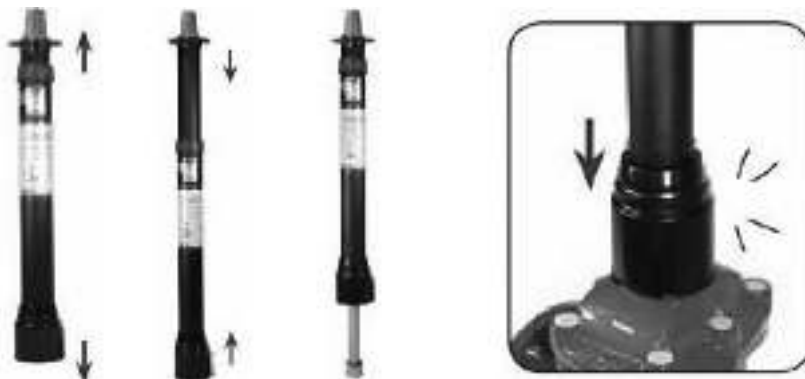
Рис. 4 Порядок установки телескопического штока на задвижку.